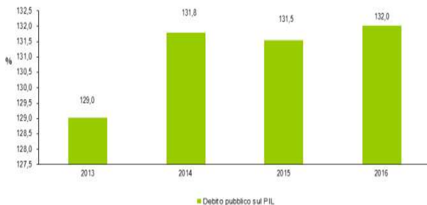
FIGURA 2. DEBITO PUBBLICO SUL PIL Anni 2013-2016, valori percentuali

(a) L'indebitamento è espresso con il segno positivo.