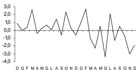
Indice del valore del totale delle vendite variazioni percentuali tendenziali