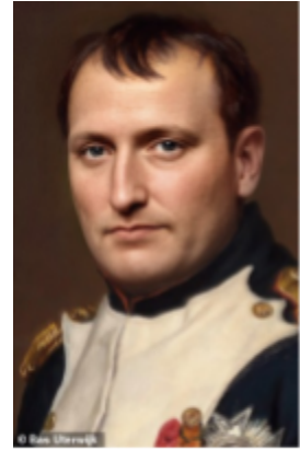
Foto da ritratto Napoleone.