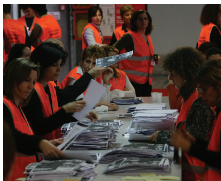
Immagini del Town Meeting di Marina di Carrara del 2006