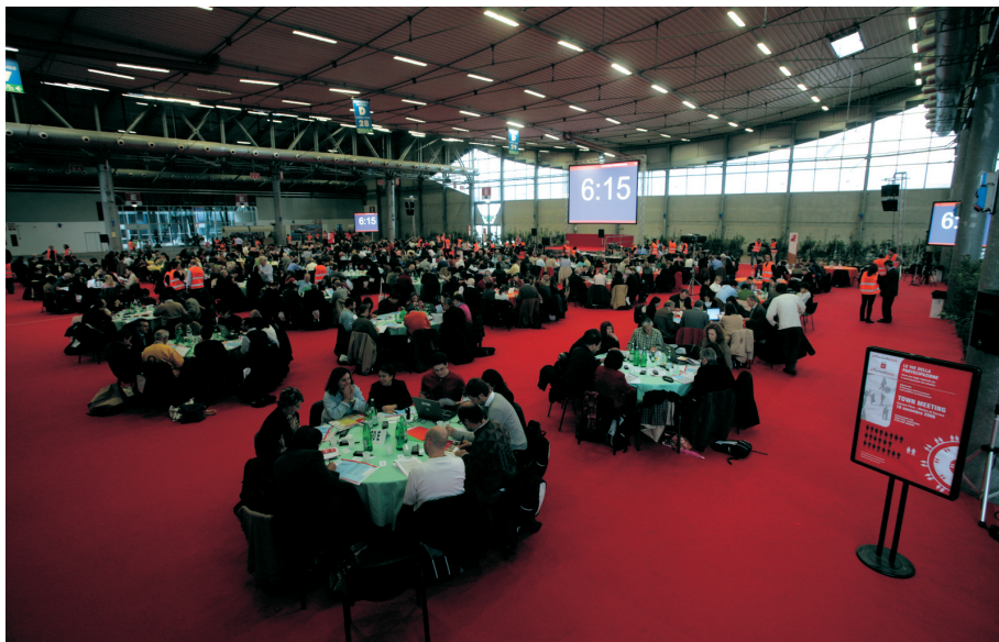
Il Town Meeting di Marina di Carrara del 2006, momento di sintesi del processo partecipativo promosso dalla Regione Toscana per elaborare la legge regionale sulla partecipazione.