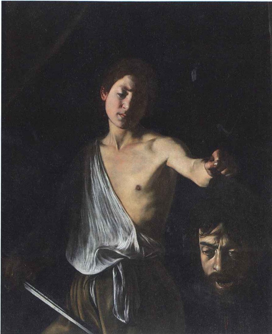
Davide con la testa di Golia di Caravaggio (1610) una tra le opere esposte alle Scuderie del Quirinale

No, se non se ne parlasse più di rilancio me ne andrei un minuto dopo. Certo dovrò cercare altrove le risorse per compensare i mancati contributi. Cosa che peraltro ho già cominciato a fare agendo sul doppio versante della riduzione delle spese e dell'aumento delle entrate. Sotto il primo aspetto ho già tagliato costi per 1,760 milioni di euro complessivi, in gran parte per la gestione della struttura, ma anche per le mostre minori e le attività di enti collegati. Sul lato delle entrate invece ho